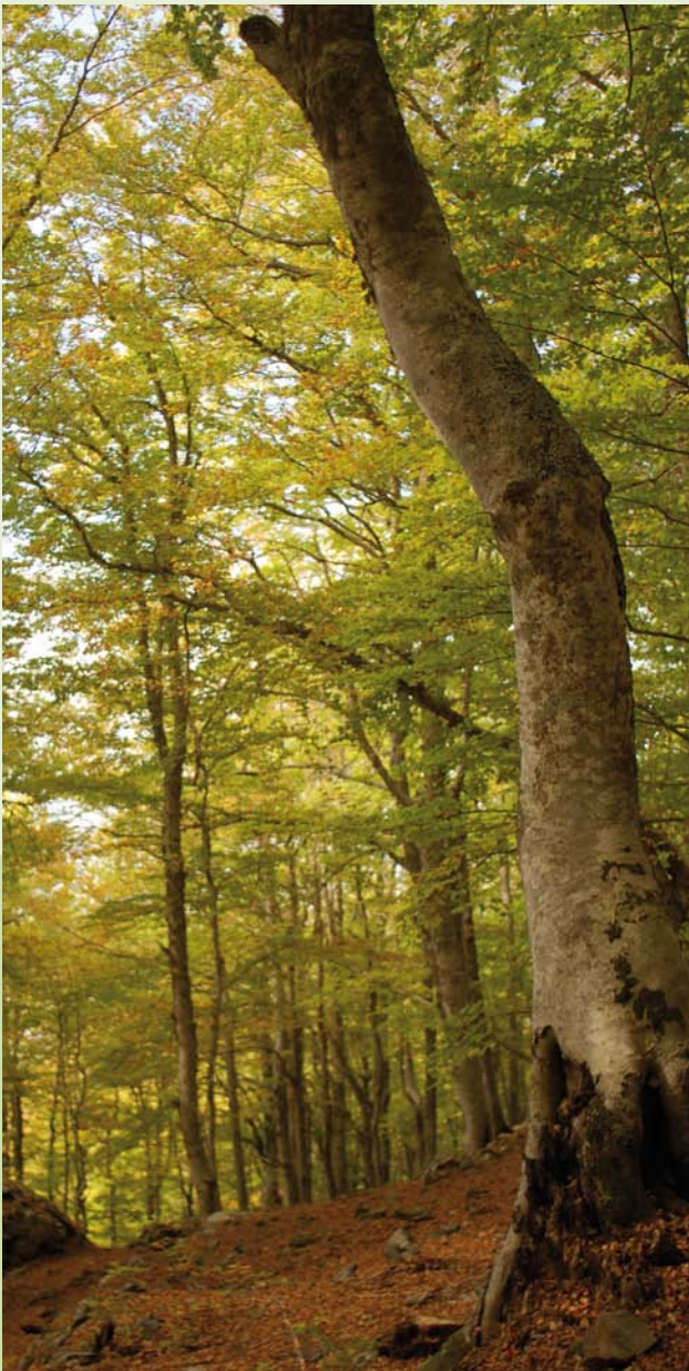
Die Rotbuche ( Fagus sylvatica ) ist ein bedeutender Forstbaum. Sie wird für 26 HKG nach FoVG angeboten.