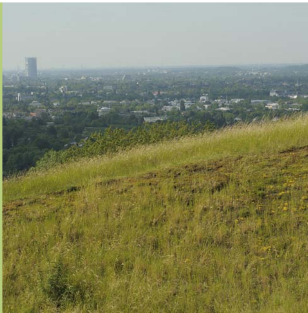
Naturschutzgebiet im Ballungsraum - die „freie Natur“ beginnt gleich außerhalb des besiedelten Bereichs.