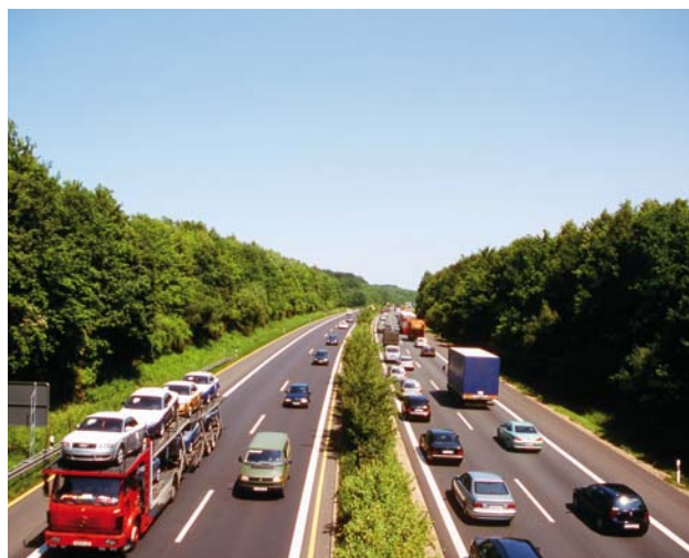
Gehölze an Verkehrswegen haben mit Extremen zu kämpfen.

Auch im Straßenbegleitgrün sollten in keinem Fall gebietsfremde invasive Gehölze verwendet werden. Nicht verwendet werden sollten gebietsfremde Herkünfte, wenn in unmittelbarer Nähe besonders schutzwürdige Bestände derselben Art (zum Beispiel ausgewiesene Generhaltungsbestände der Forstwirtschaft; Bestände in Naturschutzgebieten oder deren unmittelbaren Nähe) stehen. Von der Pflanzung gebietsfremder Herkünfte bei angrenzenden naturschutzrechtlich geschützten Gebieten (Natura-2000-Gebiete, Naturschutzgebiete) sollte auch bei Straßenbegleitgrün grundsätzlich abgesehen werden.