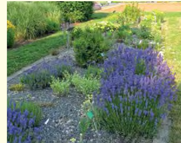
Abbildung 17: Bienenweide, Gewürz und Schmuck bis zum ersten Frost: Blühender Lavendel (Lavandula angustifolia) im Duft- und Aromabeet.

Trockene, sonnige Ecken im Garten bieten sich für die Anlage eines Duft- und Aromabeetes an (Abbildung 17 und Abbildung 18). Die Vielfalt an Düften und Aromen der „Duftpflanzen“ dienen dem eigenen Wohlbefinden und helfen den Bienen. Wird der Blühtermin der Arten bei der Auswahl berücksichtigt, können