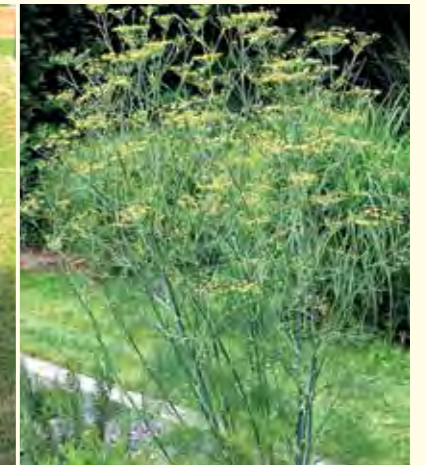
Abbildung 18: Mit Blüte- und Fruchtstand schmückt Fenchel (Foeniculum vulgare) das Duft- und Aromabeet.

Trachtlücken, die vor allem im zeitigen Frühjahr und im Spätsommer auftreten, entschärft werden. Beliebte Sommerblüher, die gerne von Bienen aufgesucht werden, sind Lavendel (Lavandula angustifolia), Katzenminze (Nepeta cataria) oder auch die Wiesenschafgarbe (Achillea millefolium), die sich für naturnahe Pflanzungen gut eignet. Im Frühjahr bzw. Frühsommer bereichern das Berg-Steinkraut (Alyssum montanum), Rosmarin (Rosmarinus officinalis) und der Echte Salbei (Salvia officinalis) das Pollen- und Nektarangebot. Davon profitieren auch Wildbienen wie z. B. die Garten-Hummel (Bombus hortorum). Eine beson-