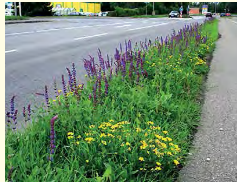
Abbildung 23: Eine einfache blühende Ansaat aus zwei Pflanzenarten, hier Salbei und Hornklee, sorgt für ausdauerndes Blütenflor mit geringem Pflegeaufwand an einem Straßenrand in Mössingen.

munen stellen sollten, sind „Warum mäht man so oft?“ und „Ist dies zwingend überall nötig?“. Oftmals reichen diese Fragen aus, um einen Denkanstoß und neue Planungsprozesse auszulösen. Ziel dieses Neudenkens ist es, insektenfreundlichere Pflegeregime Stück für Stück im Flächenmanagement der Kommune zu verankern. Große/radikale Veränderungen sind auch möglich, bedürfen jedoch längerer Vorbereitung mit breiter öffentlicher Diskussion und enger Einbeziehung der Entscheidungsträger sowie der Mitarbeiter und Bürger.