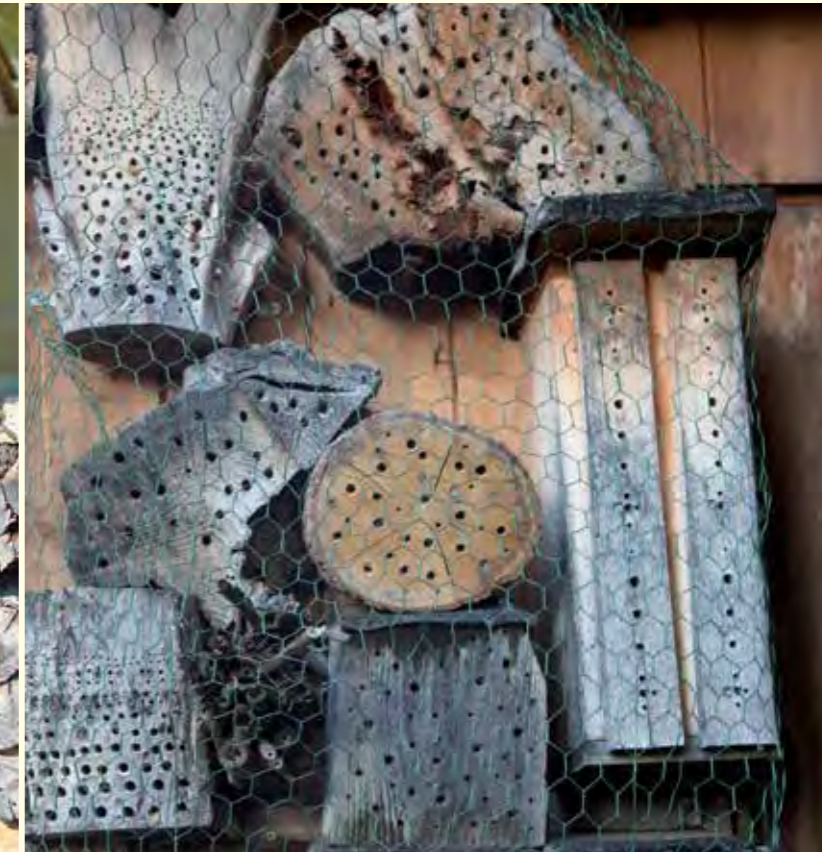
Abbildung 9: Ein Maschendraht vor dem Bienenhotel schützt vor Vogelfraß.

Etwa drei Viertel der heimischen Wildbienenarten nisten in selbstgegrabenen Gängen im Boden. Für diese Arten können ebenfalls zusätzliche Nistgelegenheiten beispielsweise in Form von künstlichen Steilwänden bereitgestellt werden. Entscheidend ist hierbei, dass das verwendete Bodensubstrat leicht grabbar ist und dennoch die Brutröhren stabil genug sind. Deshalb sollten etwa sandiger Löss und keine schweren Tonböden als Bodensubstrat Verwendung finden. Dieses Substrat kann z.B. in möglichst tiefe (> 20 cm) Blumenkästen oder Holzkästen eingefüllt werden. Übereinander