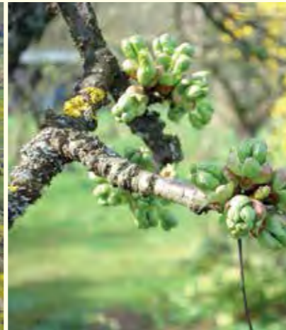
Abbildung 28: Durch geschickte Sorten- und Artenwahl kann sich die Blüte von Streuobstbeständen über nahezu zwei Monate erstrecken.