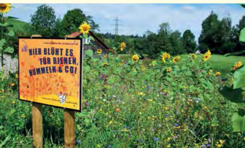
Abbildung 11: Imagegewinn für die Landwirtschaft durch Kommunikation

Im Zusammenhang mit der Erforschung nachwachsender Rohstoffe und mit Blick auf die Flächenproduktivität sowie einer Ökologisierung des Anbaus wird jedoch wieder intensiver an diesem Thema gearbeitet.