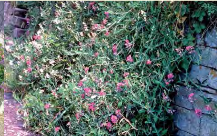
Abbildung 22: Die Breitblättrige Platterbse (Lathyrus latifolius), welche sich auch hervorragend als Sichtschutz an Zäunen oder Mauern bewährt, blüht fast den gesamten Sommer lang.

dere Augenweide sind mehrjährige Rosmarin- und Salbeibüsche, die für ein blaues Blütenmeer in den Frühlingsmonaten sorgen. Moderate Fröste, vor allem in Kombination mit Schnee, werden von ihnen gut vertragen, in höheren Lagen ist jedoch ein Frostschutz unabdingbar. In Tabelle 4 (siehe Seite 24) ist ein Beispiel für ein Duft- und Aromabeet in Form eines sogenannten „Aspektkalenders“ aufgeführt.