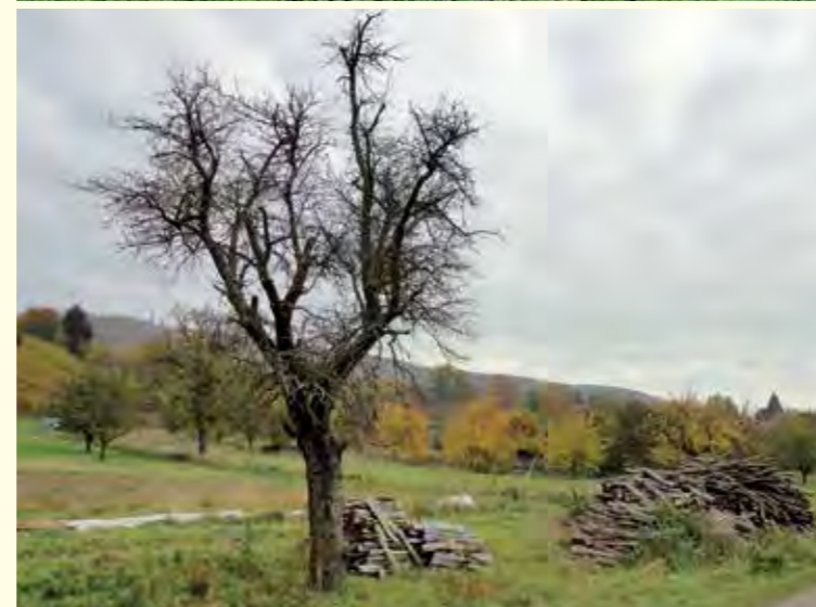
Abbildung 6 oben: Stehende abgestorbene Baumstünke stellen natürliche Nisthabitate für totholzbewohnende Wildbienen dar, etwa für die Blauschwarze Holzbiene.