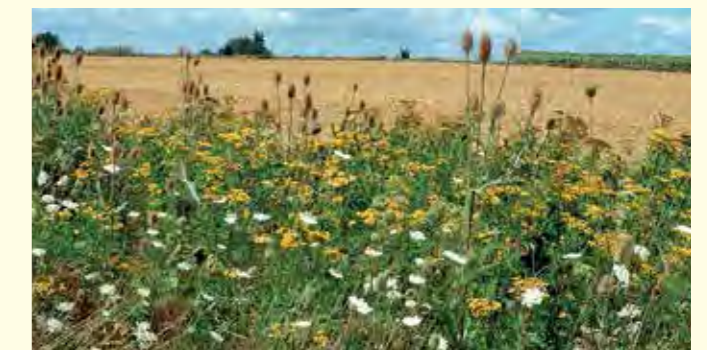
Abbildung 14: Neuanlage eines Saumbiotops im zweiten Jahr nach einer Wildkräuteraussaat auf Ackerland.

Nach dem Auflaufen der Saat konkurrieren die Keimlinge der Ansaat mit den spontan keimenden Arten aus dem vorhandenen Samenpotential des Bodens. Aus diesem entwickeln sich häufig konkurrenzstarke einjährige Ackerwildkräuter wie Melden oder Klettenlabkraut, die den Arten der Ansaat das Licht zur Keimling-