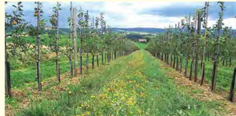
Abbildung 36 oben: Blühstreifen in der Fahrgasse einer Obstanlage Abbildung 37 unten: Holunder (Sambucus nigra) als Ankergehölz am Reihenanfang

Dabei sind im Obstbau bei der Anlage von Strukturen eine Vielzahl von pflanzenschutzfachlichen Fragen zu berücksichtigen (z.B. Zwischenwirts-pflanzen für Schaderreger, Veränderungen der Feld- und Wühlmauspopulationen). Daher ist die enge Verzahnung von Öko-Obstbauberatern und Naturschutzfachleuten notwendig und