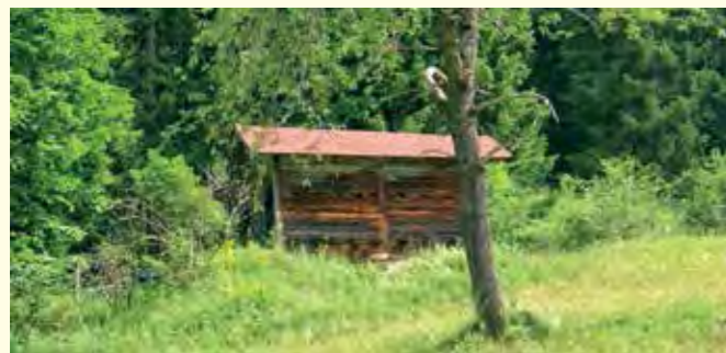
Abbildung 25: Bienenhaus am Waldrand

Mit einer Besonderheit unterscheidet sich die Imkerei ganz wesentlich von den anderen Bereichen der Landwirtschaft: In der Regel werden keine eigenen Anbauflächen benötigt. Trotzdem, oder gerade deshalb, sind Imker gefordert, wenn es um die Verbesserung des Nahrungsangebots für Insekten geht. Beispielsweise indem sie