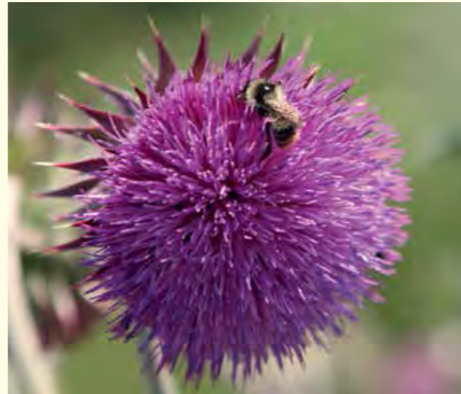
Abbildung 12: Nickende Distel ( Carduus nutans ) mit einer Arbeiterin der Bunten Hummel ( Bombus sylvarum ).

Ackerschläge lassen sich durch Ansaat mit ein- oder mehrjährigen Blühmischungen zu wertvollen Lebensräumen für die wildlebende Flora und Fauna entwickeln. Da auf den Flächen jedoch zu einem