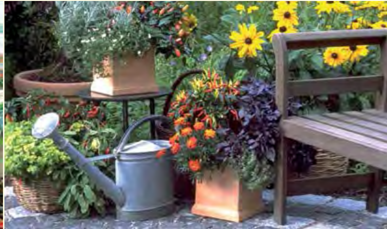
Abbildung 20: Kräuter in Kombination mit Blumen sind eine Augenweide. Hiervon werden auch die Honigbiene und einige weit verbreitete Wildbienenarten angezogen.