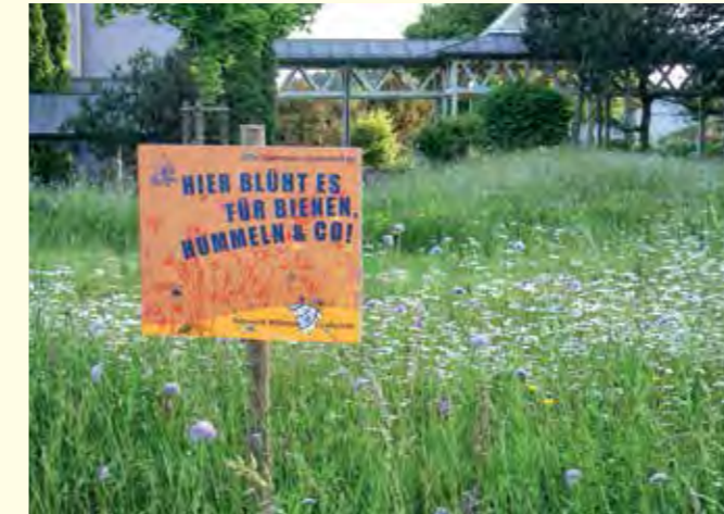
Abbildung 39: Blühende „Grünfläche“ um eine Schule in Wangen mit Informationstafel

zielführend für die Umsetzung tragfähiger Konzepte. Die Akzeptanz der Maßnahmen durch die Bewirtschafter, die letztendlich für deren Umsetzung und dauerhafte Erhaltung verantwortlich sind, steht hier im Vordergrund.