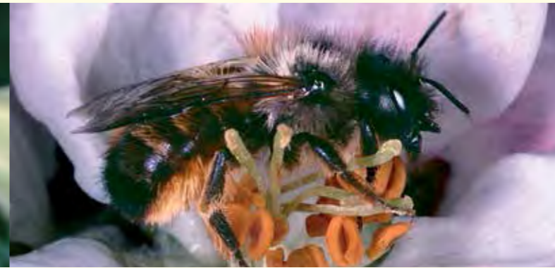
Abbildung 3: Die Rostrote Mauerbiene ( Osmia bicornis , Körperlänge 12 mm) gehört im zeitigen Frühjahr zu den Bestäubern von Obstbaumblüten.

Kulturlandschaft zumeist noch viel stärker betroffen als die Honigbiene. Wie diese sind sozial lebende Wildbienenarten, Hummeln und einige Furchenbienenarten mit einer Flugzeit vom Frühling bis in den Herbst hinein ebenfalls von einem ununterbrochenen Blütenangebot abhängig. Für Einsiedlerbienen (= Solitärbienen), welche nur eine begrenzte Flugzeit von teilweise wenigen Wochen haben, ist hingegen entscheidend, dass sie während dieser Phase ein ausgedehntes Nahrungsangebot vorfinden, zumeist in Form bestimmter – bei oligo- oder monolektischen Bienenarten weniger/ einzelner – Blütenpflanzenarten.