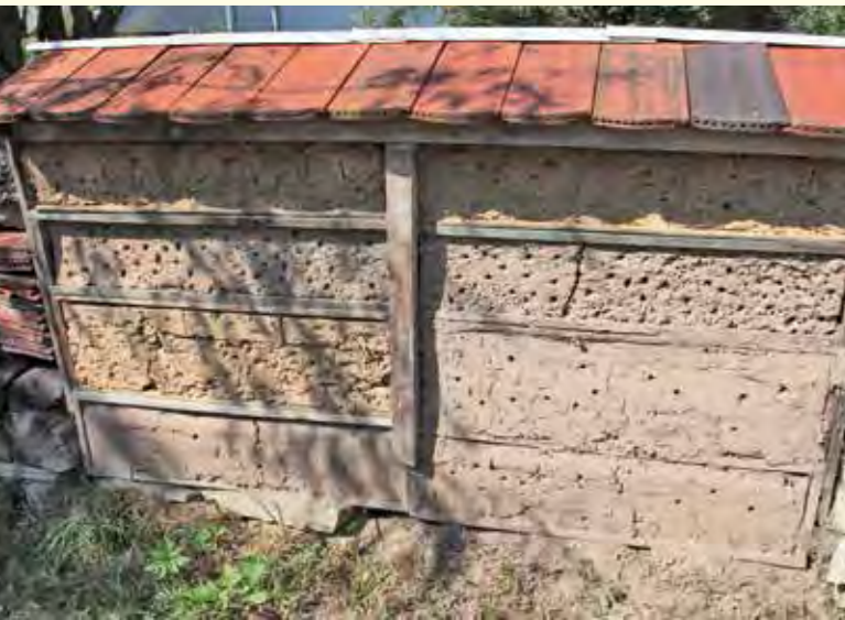
Abbildung 10: Künstliche Steilwand aus Lehm als Nisthilfe.

Im Gegensatz zu Wild- und Honigbienen sind andere Insekten in der Regel nicht ausschließlich auf Blütenprodukte als einzige Nahrungsquelle angewiesen. Außer an Blüten saugen z.B. Schmetterlinge auch an feuchter Erde, Baumsäften, Früchten, Kot, Aas oder auch Schweiß. Deshalb decken die hohen Ansprüche der Bienen an