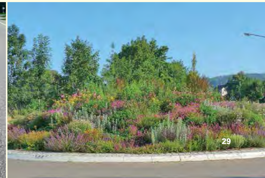
Abbildung 24: Staudenpflanzung in Donzdorf

Solche Veränderungen des Pflegeregimes erfordern in vielen Kommunen strukturelle Anpassungen mit langfristigen Umsetzungsperspektiven. Auch müssen diese Veränderungen keine völlige Abkehr von der herkömmlichen Arbeitsweise, etwa von saisonalen Schmuckbeeten bedeuten, denn viele Bürger werden dies weiterhin fordern. Ebenso gilt, dass naturnahe insektenfreundliche Pflanzungen und Pflegekonzepte nicht überall die beste und effizienteste Lösung darstellen. Doch gibt es in jeder Kommune Potentiale für ein ökologisches Umdenken im Grünflächenmanagement. Ausdauerndes Erklären und Werben für die ökologische Neuausrichtung der Pflege bei Mitarbeitern und in der Öffentlichkeit ist deshalb eine Grundlage für den langfristigen Erfolg.