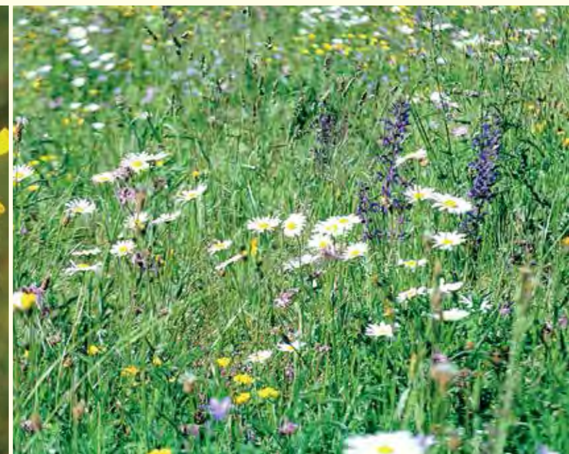
Abbildung 29: Durch die Beweidung von Streuobstwiesen können relativ blütenreiche Bestände erhalten werden.