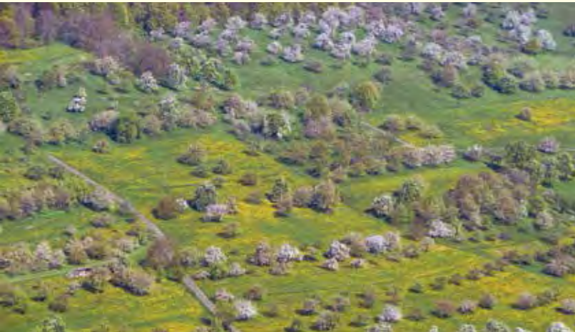
Abbildung 27: Die Kulturlandschaft Streuobst bietet Lebensraum für Insekten, Kleinsäuger sowie Sing- und Greifvögel.