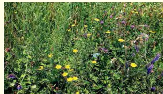
Abbildung 13: Färber-Kamille (Anthemis tinctoria), Vogel-Wicke (Vicia cracca) und Flockenblume (Centaurea jacea) am Rand eines Getreideackers.

Acker-Randstreifen bzw. von Acker-Lichtstreifen ohne größeren zusätzlichen Aufwand zu bewerkstelligen (siehe auch http://baden-wuerttemberg.nabu.de/themen/landwirtschaft/kultur-natur/ ). Der Bewirtschafter muss jedoch darauf achten, dass in Systemen von Kulturpflanzen mit eingesäten Insektentrachtpflanzen während deren Blühphase keine bienengefährlichen Pflanzenschutzmittel auf die Streifen verdriftet werden. Abbildung 13 zeigt einen blühenden Ackerrandstreifen auf einem ökologisch wirtschaftenden Betrieb. Im Übrigen sind Spritz- und Bodenbearbeitungsmaßnahmen an Ackersäumen zum Weg hin zu unterlassen. Auch diese Bereiche stellen Rückzugsräume für Flora und Fauna dar.