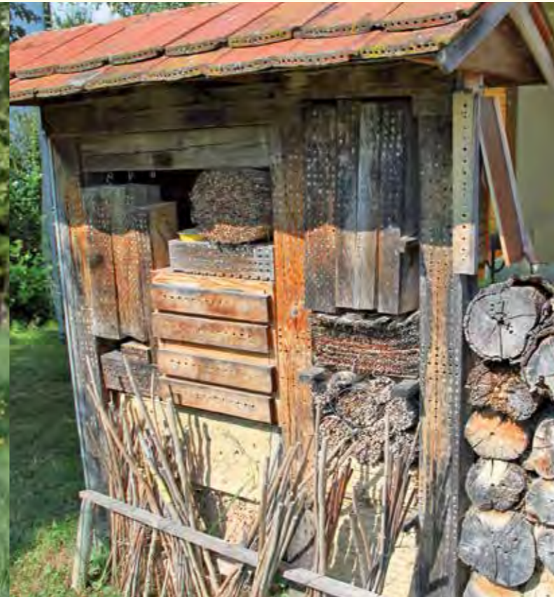
Abbildung 8: „Insektenhotel“ mit senkrecht gestellten markhaltigen Stängeln.

engem Raum leicht erreichbare Nahrung bzw. Wirte vorhanden sind. Ein Maschendraht, welcher um die Nisthilfen herum angebracht wird, beugt dem Bienenverlust durch Vögel vor (siehe Abbildung 9). Um den Parasitendruck zu vermindern, sollten nach 1 bis 2 Jahren neue Nisthilfen hinzugefügt oder an anderen Stellen in der Umgebung aufgestellt werden. Durch Aufstellen solcher