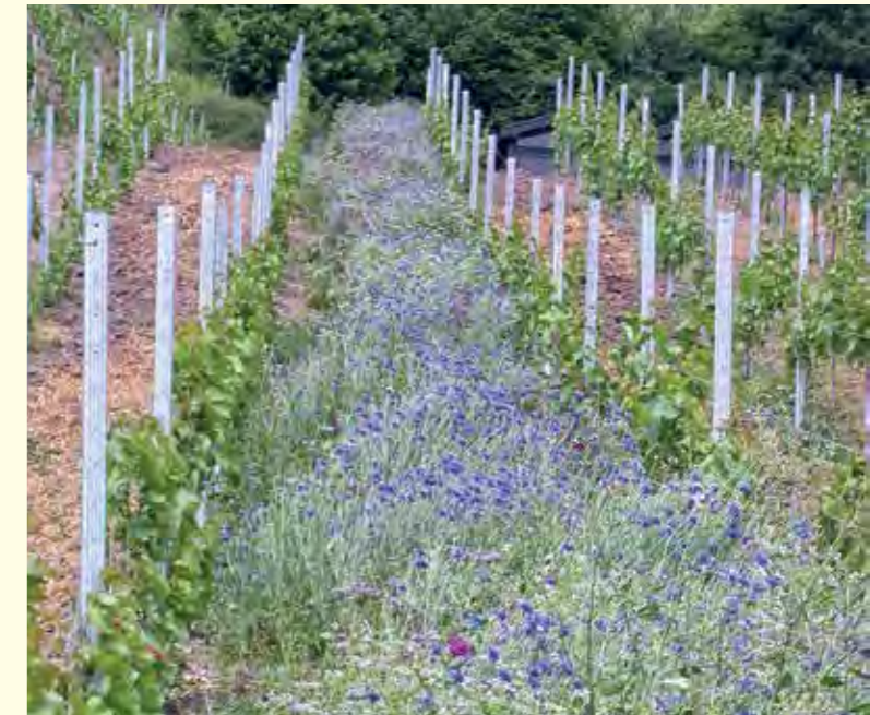
Abbildung 16: Artenreiche Blümmischung im Weinberg

Vor diesem Hintergrund ist das Belassen bereits bestehenden extensiven Grünlands die beste und kostengünstigste Methode.