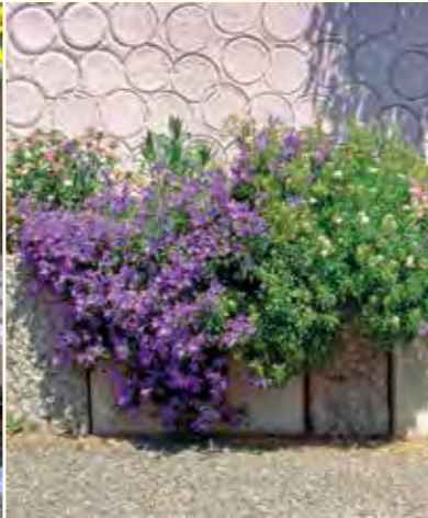
Abbildung 21: Die Polster-Glockenblume (Campanula poscharskyana) eignet sich besonders für Steingärten oder Blumenkästen.