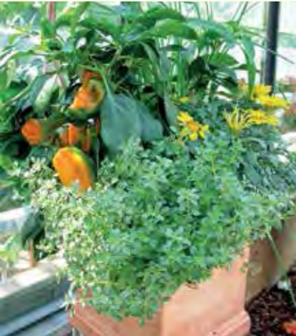
Abbildung 19: Mit Kräutern, Blumen und Balkongemüse lassen sich wunderschöne Gefäße für Auge und Gaumen gestalten. Auch für die Honigbiene stellt dieses Blütenangebot eine Bereicherung dar.