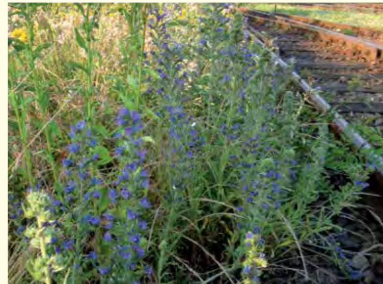
Abbildung 1 oben: Männchen der 1 cm großen Spargel-Sandbiene ( Andrena chrysope ) auf einer Blüte von wildwachsendem Spargel ( Asparagus officinalis ). Dieser blüht in Übereinstimmung mit der genetisch fixierten Flugzeit der Spargelbiene und nicht wie der Kulturspargel vier Wochen später.