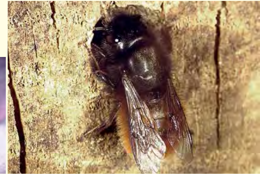
Abbildung 4 oben: Die Rotklee-Sandbiene ( Andrena labialis , Körperlänge 12 mm) am Eingang ihres Bodennests.