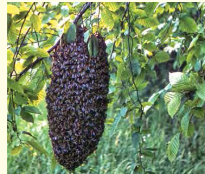
Abbildung 26: Bienenschwarm im Wald

zen Baden-Württembergs. Darüber hinaus zählen Ahorn, Linde und Eiche dazu. Diese Baumarten sollten daher an geeigneten Standorten und in der passenden Region nicht nur im Rahmen der naturnahen Waldwirtschaft, sondern auch als Nahrungsgrundlage für Bienen gefördert werden. Als wichtige Trachtquellen des Waldes sind außerdem Wildkirsche, Elsbeere, Eberesche, Faulbaum, Heidearten und spätblühende Heckenrosen (Pollen!) zu nennen. Waldbesitzer haben damit auch bei der Anlage von Forstkulturen Möglichkeiten, die Bienenweide im Wald zu verbessern.