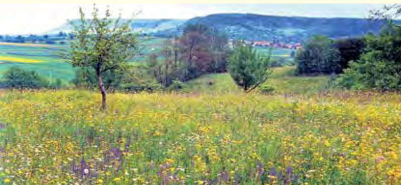
Abbildung 35: Ein Ackerrandstreifen auf der Gemarkung Heilbronn. Bunt blühende heimische Wildkräuterbestände stellen die Nahrungsgrundlage für zahlreiche Bienenarten (hier 29 Arten) dar.

Abbildung 34 unten: Neupflanzung von Obstbäumen - eine Investition für die Zukunft.